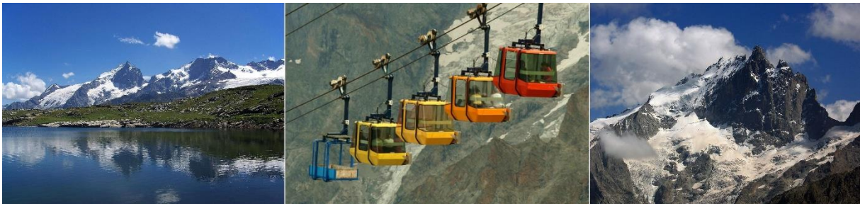
© links u. rechts: Guillaume Piolle, CC BY 3.0, Mitte: NielsB - Eigenes Werk, CC BY-SA 3.0

Am Vormittag können Sie sich entweder im Hotel verwöhnen lassen oder auf einem fakultativen Ausflug die spektakuläre Gletscherwelt von Meije und Rateau erleben. Mit dem Bus geht durch das Guisannetals. Die Seilbahn von La Grave bringt Sie auf 3.200 m Höhe mitten hinein in die imposante Bergwelt mit ihrem überwältigenden Panorama. Auch während der Mittagspause haben Sie Zeit die gewaltigen Ausblicke auf die Drei- und Viertausender des einsamen Nationalpark Écrins mit seinen mehr als 10 Gletschern auf sich wirken zu lassen.